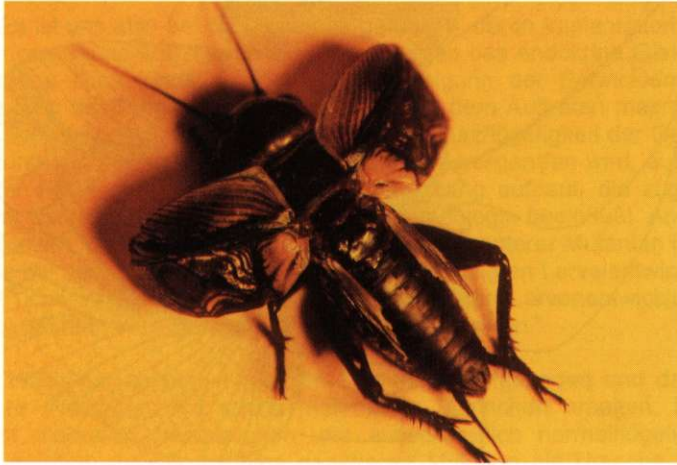
Abb. 2: Männliche Feldgrille mit aufgeklappten Elytren

Mit einem männlichen Tier wurde folgender Versuch durchgeführt: Die Grille wurde durch eine kleine Dosis Essigäther in Narkose versetzt, die etwa 20 Minuten andauerte. Die Vorderflügel wurden von Hand aufgeklappt. Diese rasteten im 90°-Winkel zum Körper ein. Dabei klappte der laterale Teil der Elytren auf, wodurch eine geschwungene Tragfläche entstand. Die Alae lagen gefaltet in Längsrichtung entlang des Abdomens. Als die Grille wieder zu sich kam, begann sie mit Schwirrbewegungen der Flugmuskulatur. Nach einigen solchen Bewegungen schnellten die Elytren in den Ruhezustand zurück.