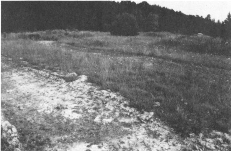
Abb. 3: Im Herbst 1992 abgeschobene Streifen (Aufnahme August 1993).

Eine schnelle, in die Fläche gehende Heideentwicklung scheint durch Abschieben von Oberboden am besten zu begünstigen bzw. zu erreichen zu sein, wie entsprechende Bestände auf jungen Rohboden-Böschungen und an anderen Störstellen im Gebiet zeigen. Bereits im Herbst 1992 wurden auf Initiative des Grünflächenamtes hin zunächst mehrere, etwa 2 m breite und 40 m lange Streifen (nördlich an die Heideflächen angrenzend bzw. in kleinen Teilen in diesen gelegen) abwechselnd flach abgeschoben oder gefräst (Abb. 3). 1993 konnten Teile der Waldheide zudem erstmals wieder mit Schafen beweidet werden.