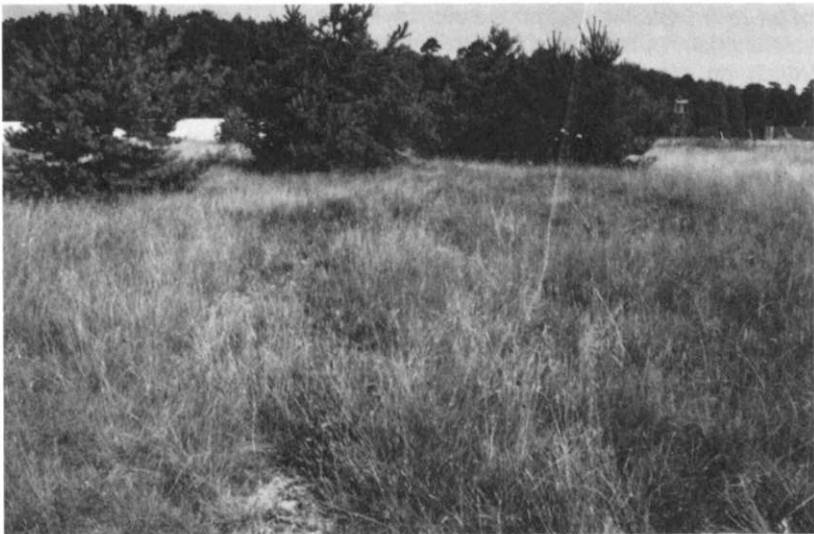
Abb. 2: Stark vergraste Heideflächen (August 1991).

Zum Zeitpunkt der ersten Bestandsaufnahmen 1991 fand sich S. stigmaticus nur auf einer etwa 1,5 bis 2 ha großen Fläche im Norden der Waldheide. Nur hier waren Heidegesellschaften in größerem Umfang ausgebildet, mit kennzeichnenden Arten wie Besenheide ( Calluna vulgaris ), Dreizahn ( Danthonia procumbens ), Gewöhnlicher Kreuzblume ( Polygala vulgaris ), Blutwurz ( Potentilla erecta ), Mausöhrchen ( Hieracium pilosella ) und Rotem Straußgras ( Agrostis capillaris ). Es handelte sich dabei nicht um Reinbestände, da sie als Folge von Teilauffüllungen und des Befahrens mit schweren Fahrzeugen von Ruderal-, Verdichtungs- und Staunässezeigern durchsetzt waren. Durch fehlende Pflege waren die Flächen z.T. stark vergrast und eine zunehmendes Gehölzaufkommen war zu verzeichnen (Abb. 2).